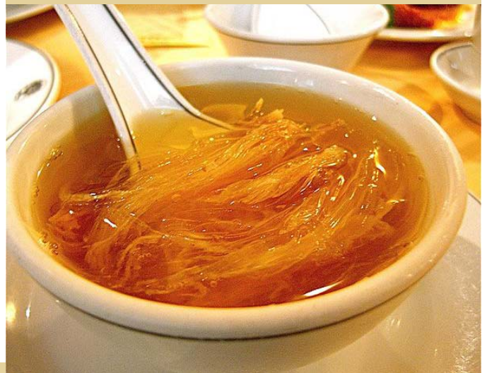
Haifischflossensuppe © Harmon