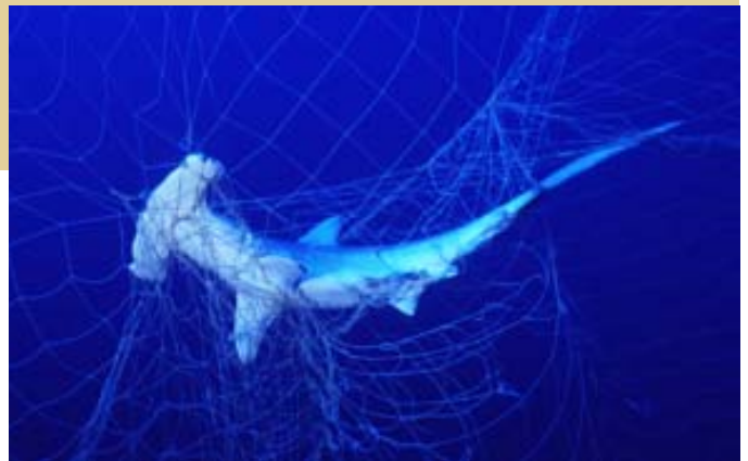
Hammerhai in Fischernetz

Der Antrag umfasst fünf Haiarten, deren große dreieckige und stark verknorpelte Flossen in Südostasien für Haiflossensuppe und andere Produkte besonders begehrt sind. Bis zu 2,7 Millionen Hammerhaie werden jährlich für den Flossenhandel gefangen. Ihre Flossen erzielen die höchsten Marktpreise. Die Bestände aller fünf Arten sind rückläufig, Bogenstimmen- und Großer Hammerhai sind laut Roter Liste stark gefährdet, die anderen drei gefährdet. Der Handel mit Bogenstimmen-Hammerhaien soll wegen der starken Überfischung beschränkt werden, die anderen vier sind wegen der Verwechslungsgefahr ihrer Flossen mit denen des Bogenstimmen-Hammerhais für eine Listung in WA II vorgeschlagen. Eine Listung aller fünf Arten ist erforderlich, damit der Zoll und andere Kontrollbehörden die Schutzbestimmungen in der Praxis auch umsetzen können.