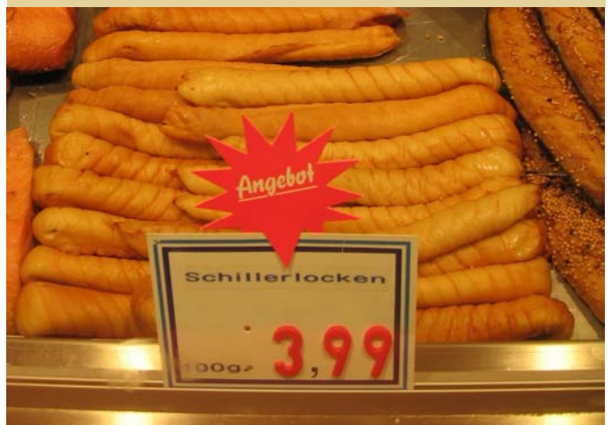
Dornhai als Schillerlocke im Handel