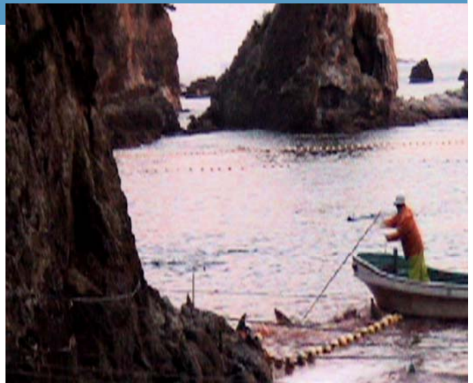
Delfinjagd in Taiji

„ Küstenjagd “ ist die dritte Methode, bei der kleinere Schiffe, die auch zur Waljagd genutzt werden, größere Arten, wie z.B. den Baird’s Schnabelwal oder den Kurzfinnen-Grindwal mit Harpunen bejagen und anlanden. Hierdurch sterben jährlich 100 bis 200 Tiere.