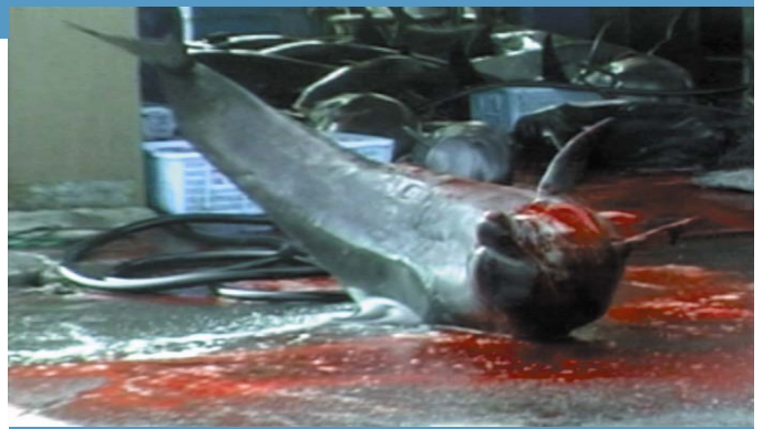
Getöteter Tümmler in Futo, Präfektur Wakayama

Außerdem werden Große Tümmler, Risso's Delfine, Streifen- und Schlankdelfine bejagt sowie Kurzflößen-Grindwale, Baird's Schnabelwale und kleine Schwertwale . Die letzten drei Arten werden, wie der