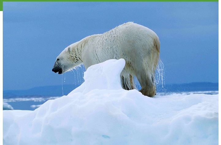
Zu früh gefreut: „Biosprit“ kann den Klimawandel nicht stoppen

Ein Beispiel: Wachsen Agrosprit-Plantagen auf Land, das vorher nicht von Torfwäldern bedeckt war, wird es 30 bis 120 Jahre dauern, bis die Treibhausgasbilanz positiv ausfällt. Müssen dagegen Torfregenwälder in Südostasien weichen, verlängert sich diese Frist auf mehr als 900 Jahre. Hier eröffnen sich gravierende Unterschiede, die berücksichtigt werden müssen. Wird tropisches Grasland zu Äckern umgewandelt, dauert es im Schnitt weniger als 100 Jahre, bis sich die Klimabilanz in den positiven Bereich bewegt. Eine Steigerung der Erträge, beispielsweise durch mehr Düngung oder ertragreichere Pflanzen, senkt die durchschnittliche Frist bis zu einer positiven CO 2 -Bilanz um 30 bis 50 Prozent. Selbst bei dieser Annahme dauert es im Schnitt aber immer noch 30 bis 300 Jahre, bis sich das Roden