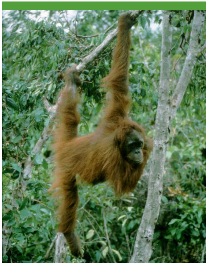
Es wird eng in den Tropen: „Biosprit“ vertreibt Orang Utans

Die geforderten 35% für deutsche Agrokraftstoffe sind nichts weiter als eine Zahl auf dem Papier – die Realität sieht anders aus! Die realen Zahlen finden kaum Gehör, die Bundesregierung profitiert von den positiven Bilanzen. Deutschland verfolgt weiterhin das Ziel, bis 2020 die Treibhausgase im Vergleich zu 1990 um 40 Prozent zu verringern. Kaum zu schaffen – und da kommen die verzerrten positiven Bilanzen im Bereich der „Biokraftstoffe“ gerade recht.