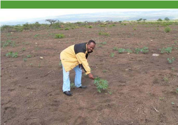
Äthiopien: Kahlschlag im Elefantenschutzgebiet für Jatropha-Anbau

Das ist bei weitem kein Einzelfall, wie ein Blick in die Zahlen zeigt: Für die Deckung des Weltenergiebedarfes durch Biomasse würde die gesamte verfügbare landwirtschaftliche Nutzfläche benötigt. Diese Einsicht hat eine kritische Teller-oder-Tank-Diskussion ausgelöst. Eine Kritik, der sich selbst die Kraftstoffindustrie nicht mehr entziehen kann. Ihre Antwort: „Biokraftstoffe“ der zweiten Generation. Pflanzen, die nicht zur Nahrungsmittelproduktion dienen, sollen das Problem entschärfen. Ein Beispiel: die Jatropha-Pflanze. Ihr Öl ist für Mensch und Tier ungenießbar – sie wächst in kargen Gebieten. Die Agrosprit-Industrie spricht gar von „wastelands“, träumt vom Anbau mitten in der Wüste. Die Realität sieht anders aus: Nur auf fruchtbaren Böden mit ausreichender Bewässerung sind die Erträge rentabel – die Nutzung von marginalen Böden also eine Mär für Biosprit-Optimisten.