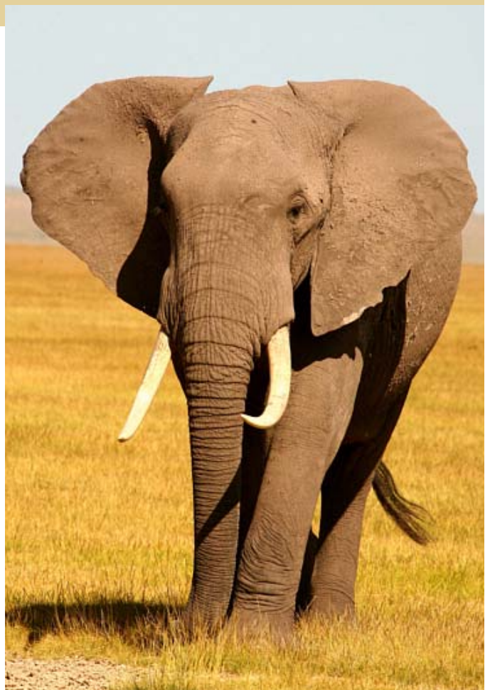
Afrikanischer Elefant

1989 stufte das WA alle Elefantenbestände von Anhang II auf Anhang I des WA hoch und verbot damit den internationalen Handel mit Elfenbein. Dies beendete die Märscher, denen in den 1970er und 1980er Jahren Hunderttausenden Elefanten zum Opfer fielen. Die Elfenbein-Absatzmärkte vieler Länder brachen zusammen, die Schwarzmarktpreise fielen rapide. Doch auf Druck der Länder im südlichen Afrika wurde das Moratorium schon bald durchlöchert: 1997 wurde der Schutz für Elefanten in Simbabwe, Botsuana und Namibia gelockert. 1999 verkauften diese Länder insgesamt 50 Tonnen Elfenbein aus Lagerbeständen nach Japan. In den Jahren 2002, 2004 und 2007 wurde der Elefantenschutz weiter unterminiert. Ende 2008 verkauften Südafrika, Simbabwe, Botsuana und Namibia insgesamt 108 Tonnen Elfenbein nach Japan und China. Als Zugeständnis an die Mehrheit afrikanischer Länder, die um ihre Elefantenbestände fürchten, sollte danach ein neunjähriges Moratorium für Elfenbeinhandel in Kraft treten. Doch jetzt stellt sich heraus, dass diese Zusage nur für die vier Länder gilt, die ihre gesamten Lagerbestände bereits verkauft haben. Auf der kommenden WA-Konferenz wollen auch Tansania und Sambia in das Elfenbeingeschäft einsteigen. Im Gegenzug fordern sieben afrikanische Staaten, mit Unterstützung vieler weiterer, dass der Elfenbeinhandel für 20 Jahre gestoppt wird und der Schutzstatus nicht für weitere Elefantenpopulationen gelockert wird.