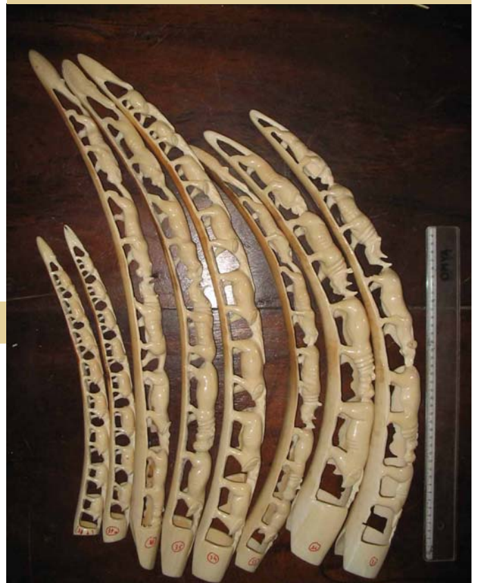
Beschlagnahmtes Elfenbein, Kamerun