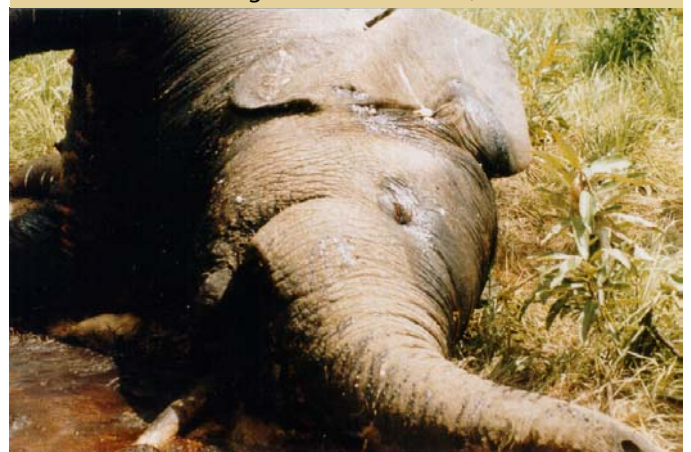
Gewildertter Elefant