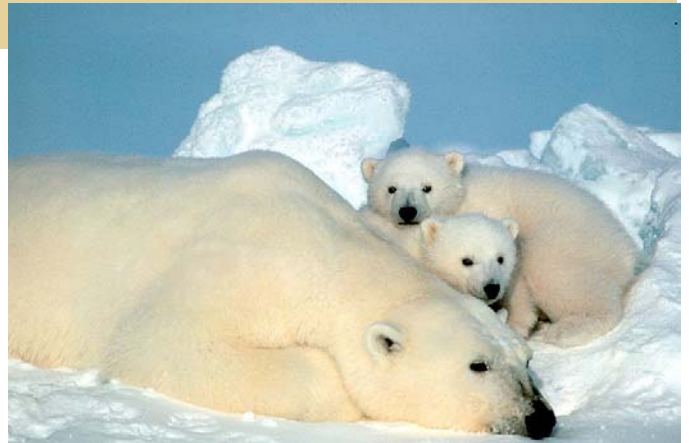
Eisbärin mit Jungtieren

Die EU verabschiedete Ende 2008 ein Importstopp für Eisbären aus den beiden kanadischen Provinzen Baffin Bay und Kane Basin, weil berechtigte Zweifel an der Nachhaltigkeit der Jagd bestehen. Allerdings läuft dieses Verbot teils ins Leere, weil es nicht für Jagdtrophäen und Touristensouvenirs gilt. Obwohl diese einen Großteil der Importe ausmachen, gelten sie als nicht-kommerziell und sind vom Handelsverbot ausgenommen. Zudem sind Importe aus anderen Beständen, die ebenfalls rückläufig sind, bislang weiterhin möglich. Hier muss die EU dringend nachbessern.