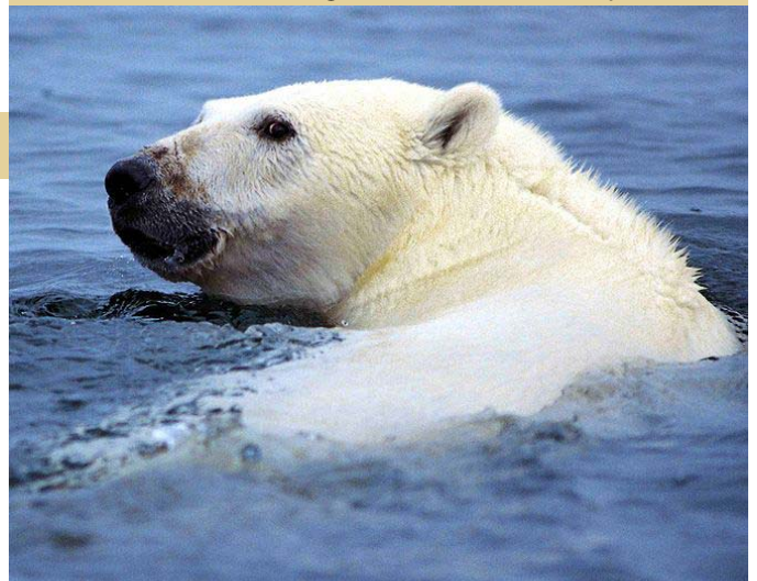
Schwimmender Eisbär